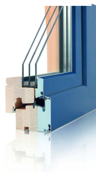
Okna a dveře pro pasivní domy