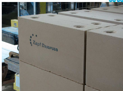
Vápenopískové cihly Kalksandstein